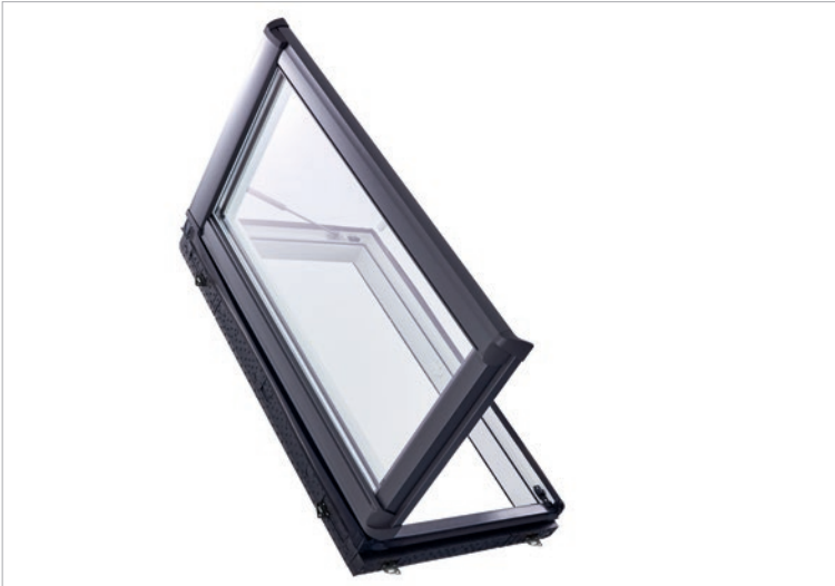
Bild zeigt Flügelanschlag rechts von innen gesehen.